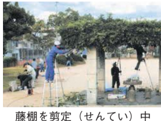
藤棚を剪定(せんてい)中