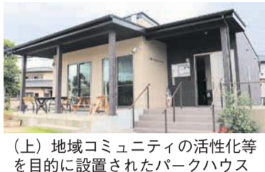
(上) 地域コミュニティの活性化等を目的に設置されたパークハウス

☎ = 日時、開催日、期間 ☎ = 場所 ☎ = 問い合わせ ☎ = 電話 ☎ = ファクス ☎ = 対象 ☎ = 定員 ☎ = 料金、費用 ☎ = 託児 ☎ = 申し込み ☎ = 持参 ☎ = メール ☎ = ホームページ