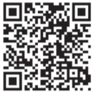
応募などスマホはこちらから

☑区内在住または通勤・通学している人 ☑電子申請システム（グラフター）のみ。1人3作品まで応募可。☑区健康づくり実行委員会（区健康課内） ☎419-1091 ☎441-0057