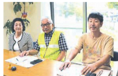
(左から) 諸藤会長、山下会長、秋山事務局長