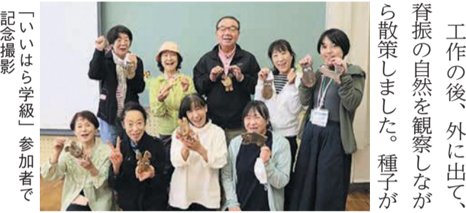
「いいはら学級」参加者で記念撮影

飯原「いつはら学級」の館外研修 飯原公民館は、地域住民同士の交流や身近な居場所づくりを目的として、「いいはら学級」という事業を年8回ほど行っています。防災や環境に関する講座、館外研修など、内容は多岐にわたります。