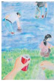
今年のポスターコンクール最優秀作品

室見川水系の自然環境を守るため、各地域で室見川・金屑(かなくず)川・油山川などの上流から下流まで、一斉清掃が行われます(雨天時は中止)。