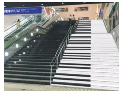
西鉄福岡(天神)駅北口に9月11日までの期間限定で設置された、上り下ると音が鳴る「巨大階段ピアノ」

市が令和元年に実施した市民アンケートによると、日頃の運動習慣(おおむね週1回以上)がない人の割合は、30〜50代の現役世代が最も多く、市民の健康を阻害している要因の一つとなっています。