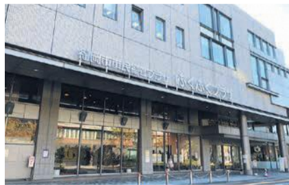
福祉活動の拠点「ふくふくプラザ」

●周囲の人ができること 虐待の多くは、近所に住む人や知り合いからの相談により発見されています。 虐待のサインには、左記のようなものがあります。少しでも虐待が疑われる場合は、区子育て支援課にお知らせください。匿名での連絡も可能です。 また、全国共通児童相談所虐待対応ダイヤル「189」に電話すると、24時間365日、最寄りの児童相談所につながります。 ☎区子育て支援課 ☎718・1106 ☎771・4955