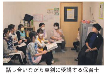
話し合いながら真剣に受講する保育士