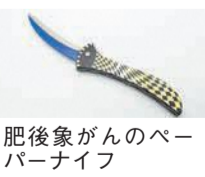
肥後象がんのペーパーナイフ

熊本の伝統工芸品である肥後象がんと小代焼を展示・販売。11月22日(火)～27日(日) 入場無料