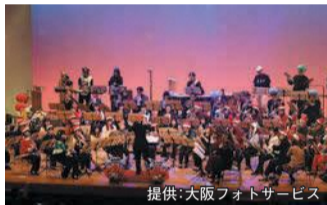
昨年度のステージ

全日本吹奏楽コンクールへの5大会連続出場を果たした、西区市民吹奏楽団のコンサートです。クラシックからアニメのメドレーまで、幅広い世代が楽しめます。迫力ある演奏をお楽しみください。