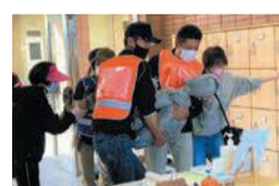
上層階への搬送訓練

になります。訓練では、実際に上層階へ抱えて搬送し、状況に応じた避難行動ができるよう連携を取りました。