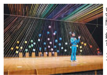
完成後に光と音の美しい空間を鑑賞します

現代芸術作家・レインボーマンと参加者全員で西市民センターのホールやロビーに虹を架けるアート作品をつくりま