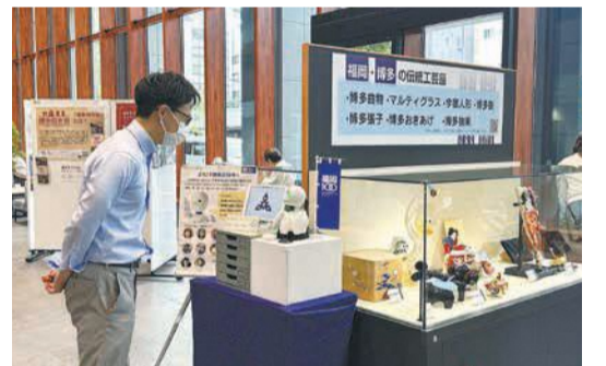
分身ロボット「OriHime」は博多区役所1階南玄関そばにいます。見かけたら、気軽に話しかけてください

12人がチームとなって、1時間交代で来庁者をおもてなしします。来庁者は、ロボットを通じて会話をしたり、案内用のタブレット端末で補足情報を得たりすることが可能です。