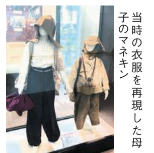
当時の衣服を再現した母子のマネキン

大戦後、日本最大級の引揚港として指定を受け、中国東北部や朝鮮半島などから約139万人の人々が引き揚げてきました。