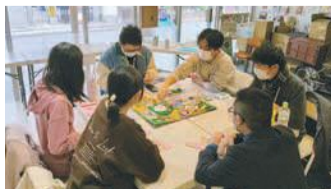
ボードゲームをする参加者

一人でのんびりしたり、ゲームやおしゃべり・卓球を楽しんだり、自習や読書をしたり、好きなことをして過ごせます。活動状況や会場が変更になる場合等はツイッター(@free space_teens)でお知らせします。問い合わせは子どもNPOセンター福岡(☎050-1743-5971 ㊟info@npoccf.jp)へ。