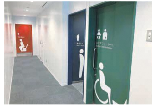
博多区役所のトイレに導入された、認知症の人にもやさしいデザイン

高齢者の7人に1人、90歳以上の3人に2人が認知症であるといわれています。市は、認知症の人が住み慣れた地域で、安心して、自分らしく暮らせるま