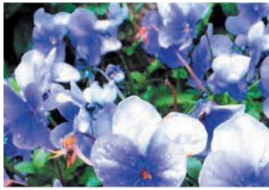
一人一花写真コンテスト(昨年)応募作品の香椎8号公園花壇のパンジー