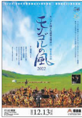
同公演のポスター

モンゴルの声楽家であるナムジン・ノロウバンザト氏が1993年の福岡アジア文化賞芸術・文化賞を受賞したことが一つのきっかけとなり、モンゴル