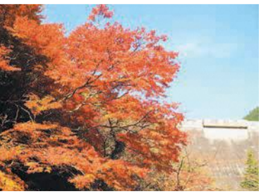
曲淵ダムパークのモミジ

紹介したスポットの見頃は年によって異なりますが、例年11月中旬頃です。区内の紅葉情報を区ホームページ(「早良区紅葉」で検索)に毎週掲載しますので、お出かけの際の参考にしてください。