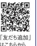
「友だち追加」はこちらから

人生100年時代を豊かに暮らすための健康・暮らし情報やイベントのお知らせなどを発信しています。「受信情報」⇒「健康・暮らし等」を選択してください。