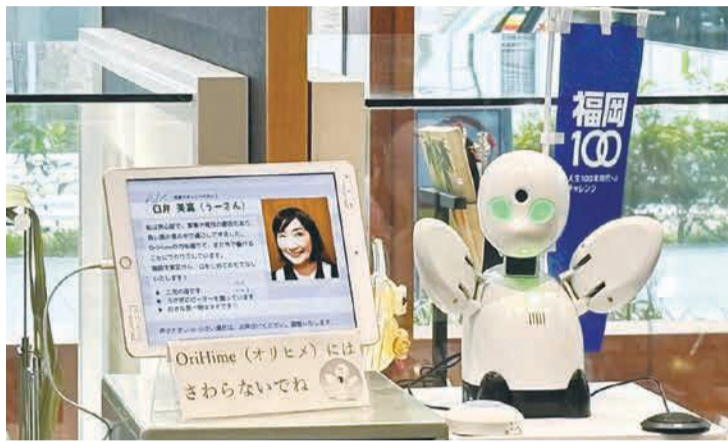
カメラ、マイク搭載の分身ロボット「OriHime」。遠隔操作で顔や腕を動かすことで感情を表現し、まるでそばにいるかのようなコミュニケーションが可能

11月30日(水)まで、博多区役所1階の博多の魅力発信コーナーで、外出が困難な人たちが博多の伝統工芸品の説明等を中心とした案内業務を行っています(平日午前11時～午後3時)。