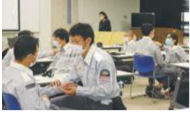
穏やかな声でゆったり、相手の目線に合わせて話しかけます

世界初の取り組みとして、市は救急隊員を対象としたユマニチュードの講座を行っています。