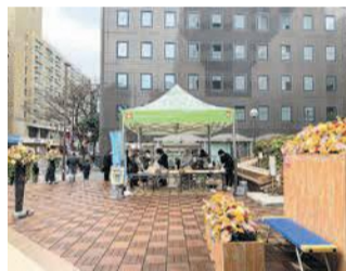
昨年度のフラワーウィーク

区役所玄関前広場を花やオブジェで装飾する「中央区花いっぱい運動フラワーウィーク」を開催しています。期間中は花やパンを販売するほか、花や庭木の手入れ方法などについて相談できる「緑の相談コーナー」も開設しています。11月14日(月)～18日(金)。物品販売は午前11時～午後3時 区企画振興課 ☎718-1015 ☎714-2141