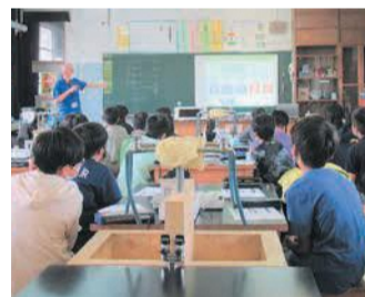
日頃の生活とエコの関係を学習

9月28日には、パナソニック株式会社から講師を迎え、筑紫丘小学校5年生を対象に「エコと太陽光発電」をテーマにした講座を開催しました。