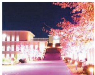
昨年のイルミネーション

福岡女子大学のキャンパスでイルミネーションの点灯式を行います。どなたでも参加できます。12月1日(木)午後6時～8時 ⑫同大学(香住ヶ丘一丁目) ☎661-2418 ⑬661-2415