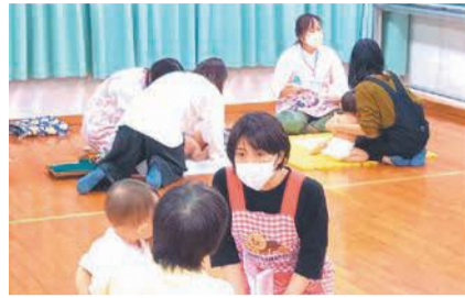
千早公民館でアドバイスを受ける母子

福岡空港周辺の騒音指定区域内で、住宅防音工事により設置した空調機器(10年以上経過し故障中)の取り換え工事に一定額を助成します。購入後の申請は対象外。市空港対策課(市役所10階)、区市民相談室等で配布する申込書を、郵送か持参で問い合わせ先へ。12月2日(金)必着。⑭空港周辺整備機構(〒812-0013博多区博多駅東二丁目17-5アークビル9階) ☎472-4594 ⑮472-4597