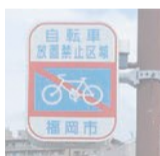
自転車放置禁止区域の標識

博多駅周辺は自転車放置禁止区域に指定されています。駐輪場に止めずに路上に放置している自転車は、通行の妨げになるため撤去されます。