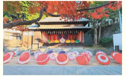
紅葉八幡宮のもみじ祭(昨年)

開 = 日時 所 = 場所 問 = 問い合わせ ☎ = 電話 ㊟ = ファクス 対 = 対象 定 = 定員 料 = 料金、費用 持 = 持参 託 = 託児 申 = 申し込み 電 = メール 開 = 開館時間 休 = 休館日