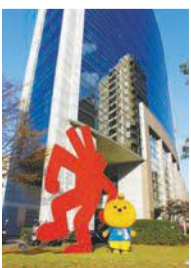
同センターの前に立つ市健康づくりキャラクター「よからもん」

休日健診(総合健診) 期①～⑩12月3日(土)、4日(日)、11日(日)、18日(日)午前8時半～10時半⑪12月18日(日)午前10時～正午 市内に住む人。①は市国民健康保険加入者。⑩は⑧か⑨の受診者で喫煙など一定の条件の該当者 先着順 一部減免あり 3ヵ月～小学3年生(無料。希望日の4日前までに要予約) 電話か来所、ホームページで2日前までに予約を。