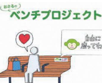
通称「おさるのベンチ」が市内各所に次々と設置されています

市は、高齢者や障がい者、妊婦、子ども連れの人などからの休憩需要に応えるため、歩道上