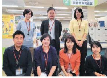
区子育て支援課のスタッフ

11月26日(土)は午後8時半まで開園します。幻想的な夜の日本庭園をお楽しみください。 ☎松風園管理事務所 ☎平尾三丁目 ☎524-8264