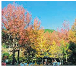
モミジバフウは葉が大きいのが特徴

道沿いに「モミジバフウ」の木が立ち並び、モミジとはまた違った、紫がかった美しい赤を楽しむことができます。傾斜が少ない道なので、子どもやお年寄り、車いすを利用する人でも気軽に散策できます。