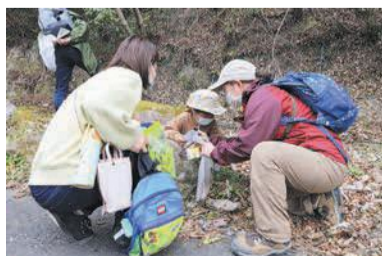
③森の自然かんさつ会

中学生以下は保護者同伴。開12月11日(日) 午前10時半～午後0時半 各20人(抽選) 要 200円