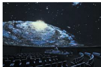
プラネタリウム番組

来年9月30日(土)まで、年間パスポートの提示で同館のプラネタリウムスペシャル番組を2割引の料金で利用できます。開年間パスポート=大人3,060円、高校生1,830円、小中学生1,020円 同館