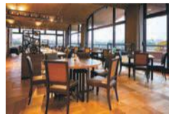
☎983-8050 市美術館に準ずる

市美術館2階に、ホテルニューオータニ博多が運営するレストラン「プルヌス」があります。10月まで午前11時～午後6時半だった営業時間が、11月から平日は午前11時～午後8時半、土日祝日は午前9時半～午後8時半に変わります(最終オーダー7時半)。大濠公園を一望しながら、お食事をお楽しみください。