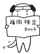
「福岡検定」キャラクター・オッベケケン

各級の合格者には、「認定証」と「福岡おもてなしマイスターバッジ」が進呈されるほか、市内の観光施設等で、利用料の割引や免除などの特典も受けられます。