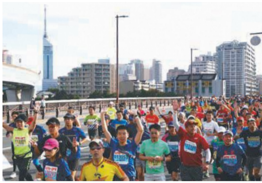
愛宕大橋を走るランナーたち(2019年大会)

5・2キロを走るファンランと車いす競技は百道浜(早良区)と車いす競技は百道浜(早良区)