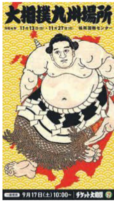
大相撲九州場所のポスター

11月13日(日)から27日(日)までの15日間、福岡国際センター(博多区築港本町)で大相撲九州場所が開催されます。