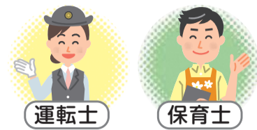
男性も女性も、意欲に応じてあらゆる分野で活躍できる社会へ

「男女共同参画社会」とは、男女が、互いに人権を尊重しながら、責任を分かち合い、性別にかかわらず、個性と能力を十分に発揮できる社会のことです。みんなで「男女共同参画社会」に