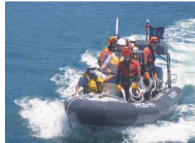
海難事故救助訓練

消防音楽隊の演奏や西消防団 纏太鼓演技などのステージイベントのほか、消防艇や消防ヘリも登場し、海上保安庁による海難事故救助訓練も行われます。消防車等の車両や各団体のキャラクターも大集合するなど、子供から大人まで楽しみながら学べるイベントです。全問正解すると備蓄食等ももらえるクイズラリーも実施するので、家族で参加して、いざというときの防災対策について考えるきっかけにしてください。イベントの詳細は、市ホームページ(福岡市 防災フェア)で検索)でご確認ください。※少雨決行。雨天時はイベントの内容が変更になる場合があります。