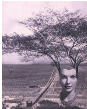
岡上淑子《新たなる季節》 1955年、高知県立美術館蔵