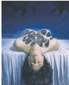
藤野一友《抽象的な籠》 1964年、福岡市美術館蔵