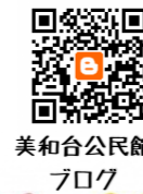
美和台公民館 ブログ