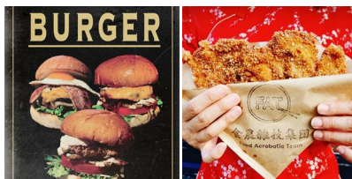
キッチンカーの料理一例

有名シェフが監修するシュークリーム、ボリューム満点のハンバーガー、ボルドーワインやカリフォルニアビールなどが楽しめます。