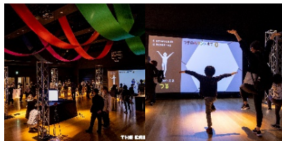
遊べる！デジタルアート展の様子（昨年）

子どもたちが楽しめるような「音」と「映像」で遊べる体験型のデジタルアート展を開催します。