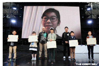
表彰式の昨年度の様子