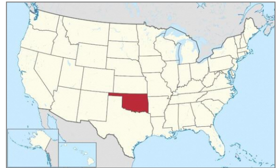
File:Oklahoma in United States.svg

オクラホマ州 は、西部開拓時代の歴史やアメリカ先住民文化が融合する、国土のほぼ中央に位置する州です。州都および最大の都市であるオクラホマ・シティは、多くのネイティブアメリカンが住む、多様性のある都市です。