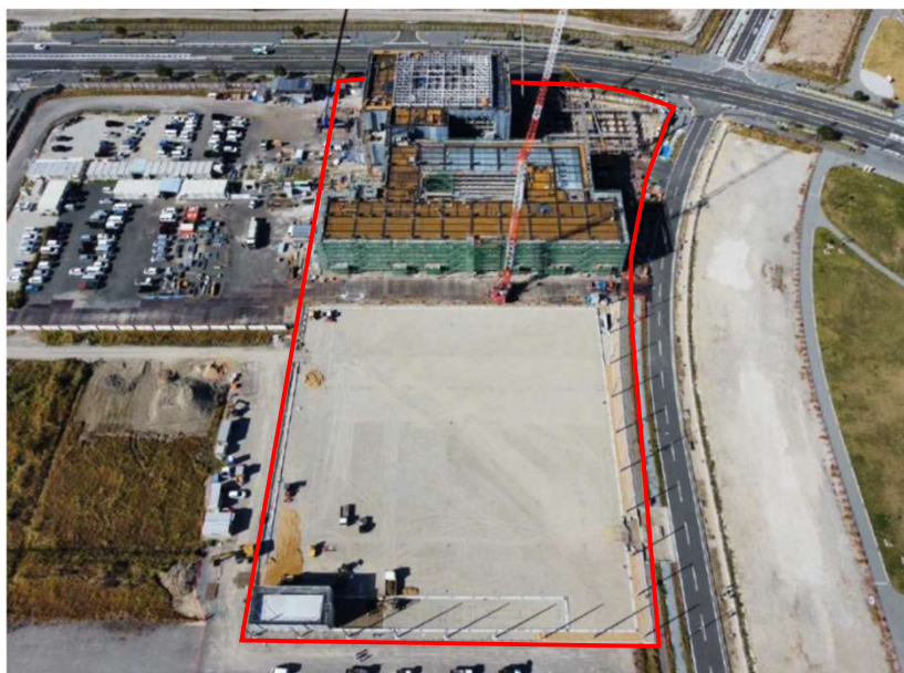
南方向からの写真