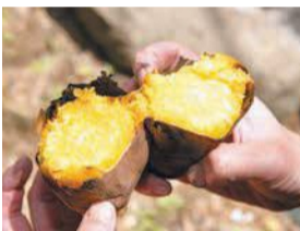
自然の中で出来たてを

いろいろな道具を使って火おこしに挑戦。火おこしの後は脇山産のサツマイモを焼き芋にして、秋の味覚を堪能します。