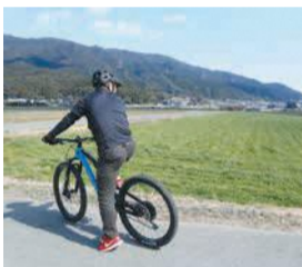
秋の風を感じながらサイクリングしませんか

ジャイアントストア福岡店の協力の下、室見川河川敷や脇山周辺の紅葉などを楽しみながら約30kmのコースを散策します。