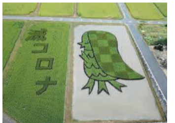
昨年の田んぼアート

3種類の稲で描かれた広大なアートを、臨時に作られたやぐらから見ることができます。