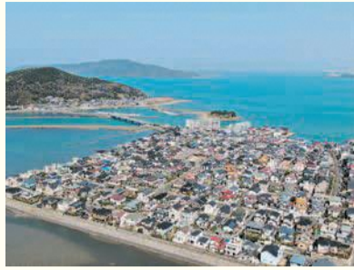
横浜の街並みと今津湾