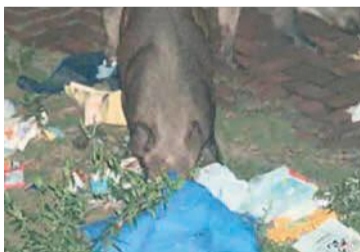
ごみをあさるイノシシ

生ごみや家庭菜園の収穫物など、イノシシの餌になるようなものを放置しないようにしましょう。餌を与えると、人に慣れ、頻繁に出没するようになるので、絶対にやめてください。