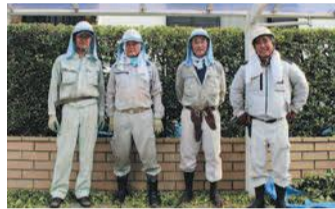
剪定班のみなさん

班の全員で年に1回、剪定技術を高めるための講習会と検定試験を受けています。AからCまでの3つのランクがあり、試験に合格しなければ剪定が難しい木の作業は行えません。一番難易度が高い松などを剪定するAランクの到達には3～4年近くかかります。私は3年目でAランクの試験に合格しました。