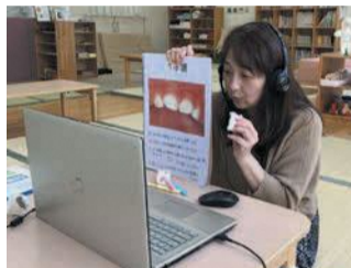
乳幼児の歯磨きについて、写真を見せながら説明する相談員

専門相談Ⅱ写真Ⅱでは、小児科医、歯科衛生士、保健師、栄養士が子どもの発育・発達や離乳食を始めるタイミングなど、子育てに関する心配事や不安に答えます。