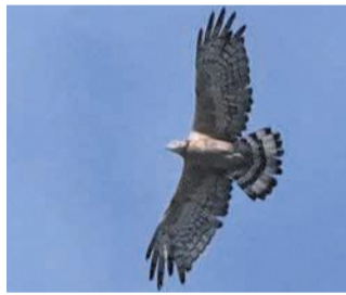
油山の上空を飛ぶハチクマ

開催日や申し込み方法などの詳細は、本紙12面情報BOXまたは市ホームページ(「城南区ほめる 教える」で検索)でご確認ください。