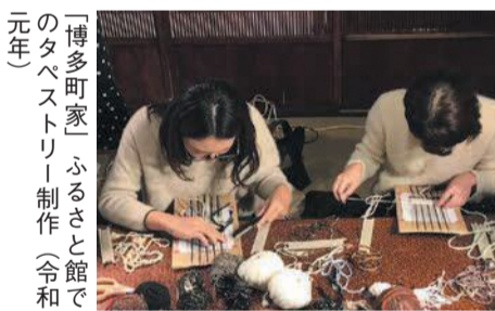
「博多町家」ふるさと館でのタペストリー制作(令和元年)

9月～11月にかけて開催される祭りやイベントを「博多秋博」として紹介しています。詳しくは、ホームページ(「博多秋博」で検索)でご確認ください。