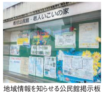
地域情報を知らせる公民館掲示板