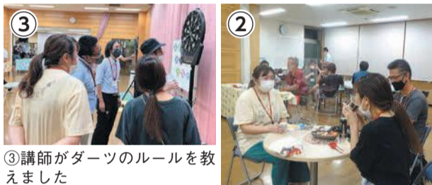
③講師がダーツのルールを教えました