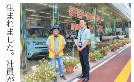
花壇前に並ぶ関店長(右)と高木さん