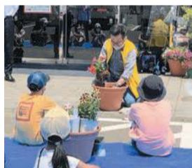
緑のコーディネーターから花の植え方を学ぶ児童

パートナー花壇の登録を受けているホンダカーズ福岡赤坂店(赤坂一丁目)は、赤坂小学校の児童と一緒に花壇作りをしています。明治通り沿いの店舗前に並べられた