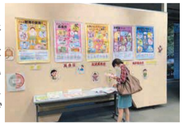
健康づくり月間のパネル展

期10月3日(月)～6日(木)の午前10時～午後2時 所あいきる1階コミュニティプラザ(舞鶴二丁目)