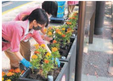
中央区花いっぱい運動の植花作業

区は、まちに彩りや潤いを与え、住民の地域を思う心を育てようと、平成8年から「中央区花いっぱい運動」に取り組んでいます。平成30年から「一人一花運動」を推進し、花いっぱい運動を続けています。