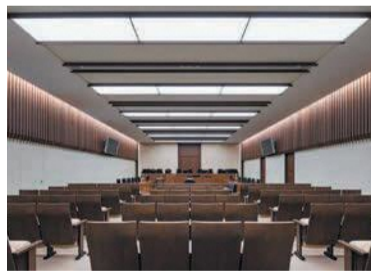
大合議法廷 (だいごうぎほうてい)

今年4月1日から、成年年齢が18歳に引き下げられたことにより、来年から18・19歳の人も裁判員に選ばれる可能性があります。若者向けに裁判員制度に関するパンフ