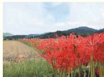
脇山に咲くヒガンバナ

期=日時 所=場所 問=問い合わせ ☎=電話 F=ファクス 対=対象 定=定員 料=料金、費用 持=持参 託=託児 申=申し込み 電=メール 開=開館時間 休=休館日