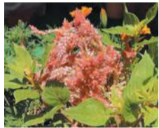
花壇に咲く大きなケイトウ

「どろんこ保育園(住吉一丁目)」は、門扉から建物入り口までの通路に設置している花壇をパートナー花壇として登録しています。