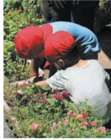
園児も花壇に興味津々

いる花を室内に飾るといった、園の活動にも役立っています。花壇は、園児が親しみやすい色を中心に、季節の花で常に満たしたいです」と笑顔で話してくれました。