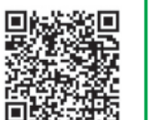
詳細はこちらから