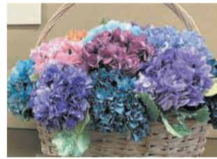
作品は約1カ月間展示(写真は昨年度の作品)

詳しくは、公民館等で配布するチラシや区ホームページ(「博多区一人一花運動」で検索)でご確認ください。