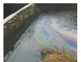
油膜が浮いた河川