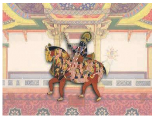
《SpiNN》2003年 福岡アジア美術館所蔵

※9月30日(金)午後6時半から、同館8階あじびホールでシンジャ・シカンダー氏の市民フォーラムを行います。参加は無料です。詳しくはホームページ(「福岡アジア文化賞」で検索)で確認するか、アジア連携課(☎711・4930 ☎735・4130)にお問い合わせを。