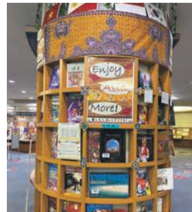
毎年好評の「図書館司書おすすめアジア本」コーナー(写真は昨年)

福岡市の友好都市である中国・広州市からの寄贈図書コーナーのほか、日中国交正常化50周年コーナーや、同館の司書がおすすめするアジアに関する本のコーナーなど、盛りだくさんの内容でアジアの書籍を紹介いたします。