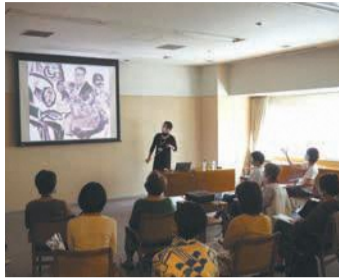
ワークショップ(昨年)

期 11月20日(日)午前10時～午後5時(受け付けは9時半から) 所 福岡アジア美術