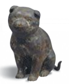
重要文化財 子犬 鎌倉時代 13世紀 京都・高山寺蔵

京都・梅尾の高山寺に所蔵される国宝《鳥獣戯画》(鳥獣人物戯画)は、日本美術の中でも人気のある作品の一つです。