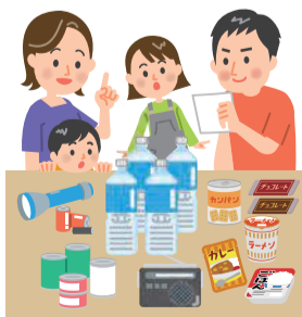
最低でも3日分の水や食料を備えておきましょう

ローリングストック法とは、普段から食料や生活必需品をやや多めに購入しておき、賞味(使用)期限が短いものから順に使用し、その分を随時買い足して