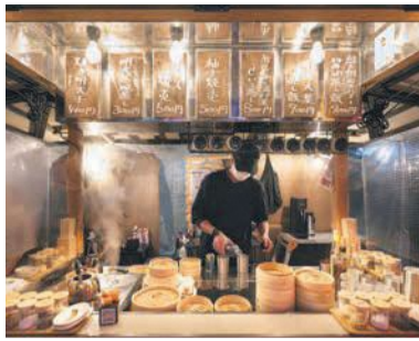
昨年10月に新規参入した、シューマイなどの蒸し料理専門屋台「ヒーローズ屋台蒸上(じょうじょう)」

屋台は、戦後の混乱期に誕生し、昭和40年代には400軒を超える屋台が市内で営業していた。