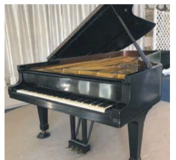
2007年ごろまで使用されていた1963年のスタインウェイ社製ピアノ

・目標金額 110万円 ・募集期間 10月31日(月)まで 1万円以上支援した人を、来