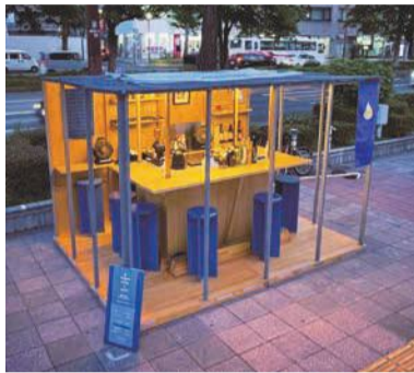
昨年度のグッドデザイン賞を受賞した「メガネコーヒー&スピリッツ」

市は、福岡ならではの観光資源である屋台を未来に残していくために、営業者が守るべき基本条例を全国で初めて制定