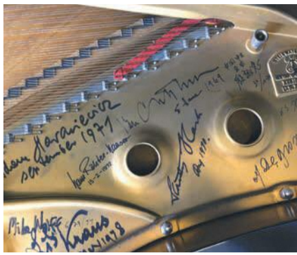
演奏家たちの自筆サイン

市文化芸術振興財団 ☎263-6265(平日午前9時半～午後5時) ☎263-6259 ☒b-osyu@ffac.or.jp