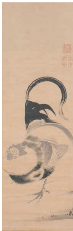
鶏図 伊藤若冲 江戸時代 18世紀 熊本県立美術館蔵