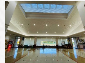
● コミュニティサービス棟