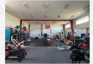
● トレーニングルーム