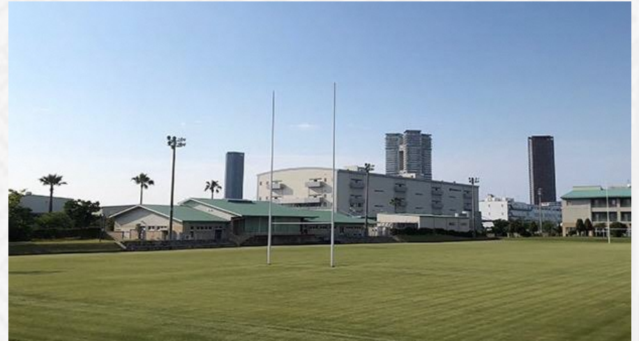
● メイングラウンド