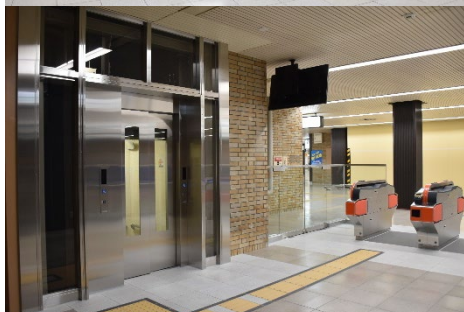
地下1階 筑紫口コンコース