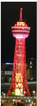
博多ポートタワー