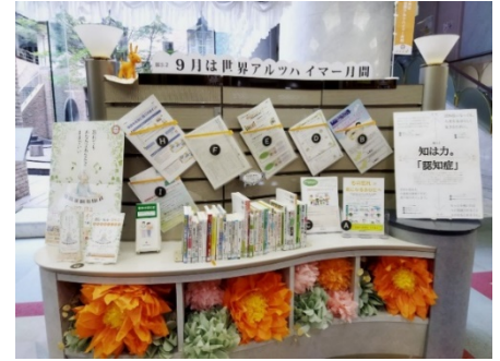
福岡市総合図書館

※早良南図書館がある「早良南地域交流センター ともてらす早良」は、建物全体に認知症の人にも優しいデザインを導入しています。