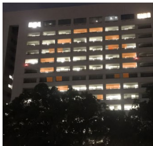
オレンジリングドレスアップ