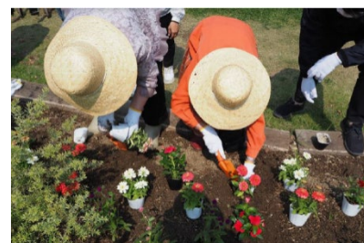
「らく楽ガーデン」活動の様子

園芸に触れることでうまれる生きがいづくりや、「老いることを楽しむ」社会の実現に向けてはじめた事業です。