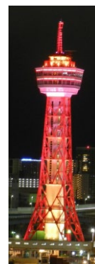
博多ポートタワー