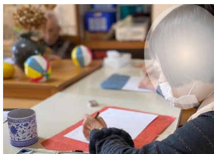
デイサービスでの絵画教室の様子