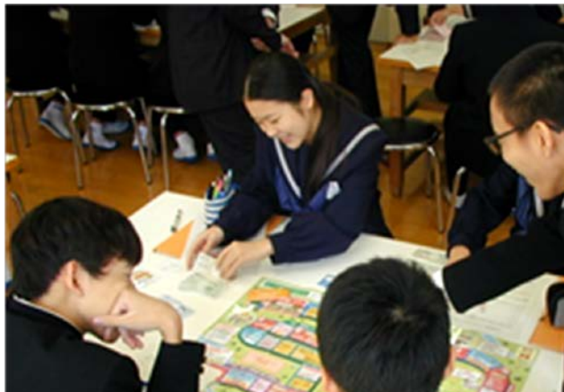
〈ライフサクルゲームⅡを活用した授業の様子〉