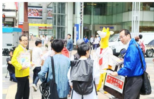
【平成 29 年度 キャンペーンの様子】