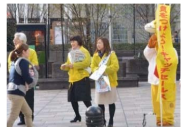
【平成 28 年度のキャンペーンの様子】