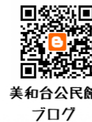
美和台公民館 ブログ