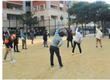
さわやかラジオ体操(薬院公園)