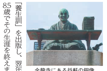
金龍寺にある益軒の銅像

明暦2(1656)年、3代藩主の光之に仕え、その命により京都で朱子学を学ぶと、後に歴史学や地理学、医学、本草学など、さまざまな分野で才能を発揮し、名声を高めていきました。