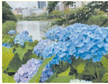
舞鶴公園のアジサイ(昨年)

〒810-8622 中央区大名二丁目5-31 区役所代表電話 ☎714-2131