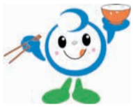
市食育推進キャラクター「いくちゃん」

毎年6月は「食育月間」、毎月19日は「食育の日」です。健康な体は正しい食生活でつくられます。できることから実践しましょう。