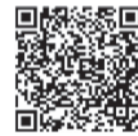
アイフォーンはこちらから

最新の気象情報や避難情報の入手が不可欠です。市の防災アプリ「ツナガル+（プラス）」では、近くの避難所の位置や設備一覧が地図で表示され、避難所へのルートも確認できます。