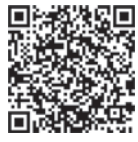
スマホはこちらから

関市に住民登録をしている満70歳以上で、市の介護保険料の所得段階区分が1～7相当の人申高齢者乗車券郵送受付センター（〒812-8623 住所不要）へ申請書を封筒に入れて郵送するか右コードから申請してください（毎年申請手続きが必要です）。9月中の交付を希望する人は8月25日(日)（必着）までに申請してください。※申請書は市ホームページ（「福岡市 高齢者乗車券」で検索）でダウンロードできます。各公民館や区役所などでも配布しています。