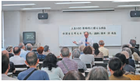
人生100年時代に備える講座

また、65歳以上の高齢者がいる世帯のうち、約7割が高齢者のみの世帯で、オートロックマン