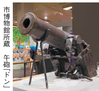
市博物館所蔵 午砲「ドン」

現在、ひとり親家庭等医療証を持ち10月1日以降も引き続き対象となる人に申請書を郵送しています。必要事項を記入して、8月19日(月)必着で返送してください。新しい医療証は、9月末までに郵送します。☒区保険年金課 ☎718-1124 ☒725-2117