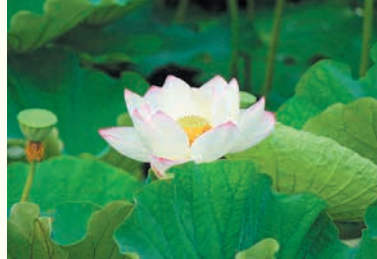
福岡城跡のハスの花

〒810-8622 中央区大名二丁目5-31 区役所代表電話 ☎714-2131