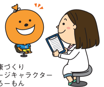
市健康づくりイメージキャラクター よかるーもん