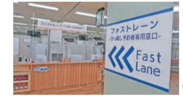
予約者専用窓口ファストレーン

窓口に行かずにオンラインで手続きできるサービスを、市全体で順次拡大していきます。