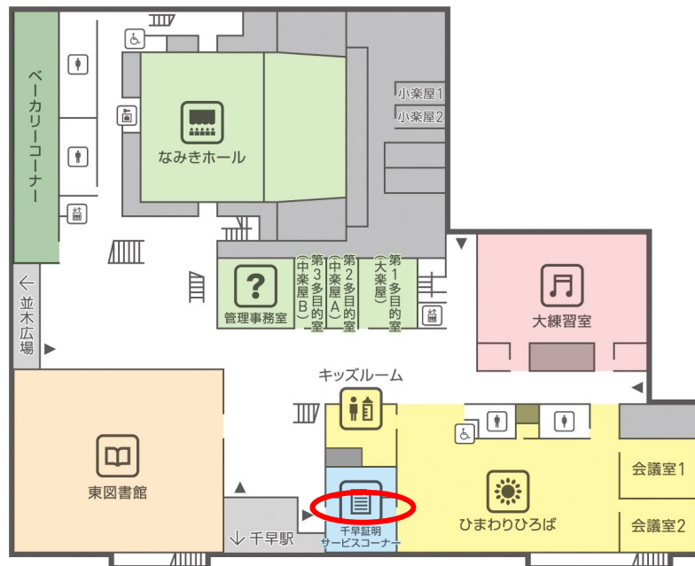
なみきスクエア 1 階フロア図