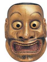
《能面 大飛出》 福岡市博物館蔵