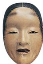
《能面 曲見》 福岡市博物館蔵