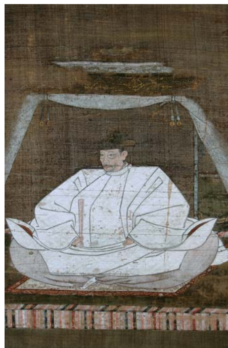
《豊臣秀吉像》 佐賀県立名護屋城博物館蔵

〒814-0001 福岡市早良区百道浜3丁目1の1 ☎092-845-5011 092-845-5019 福岡市博物館 検索