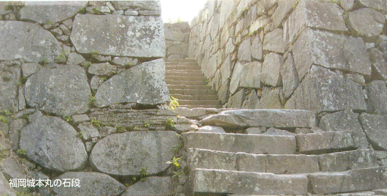
福岡城本丸の石段