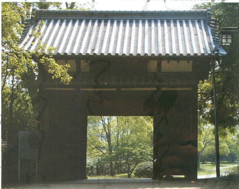
今も残る福岡藩家臣の屋敷門(現在、福岡城跡に移築の「名島門」)