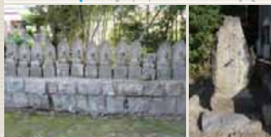
壱安神社周辺の史跡【図：上】 十三仏【写真：左下】 庚申塔【写真：右下】

柏原の石碑・祠などの史跡をたずねてみると、ある一定の地域内によくも集まっていることに気づきます。旧柏原村の村社だった壱安神社の周辺（柏原1丁目・4丁目）に、6基の庚申塔のほか、観音堂、地藏堂、十三仏が祭られているのです。