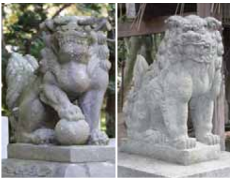
▲五社神社の狛犬【左】：浮羽産の黒い凝灰岩で造られている ▲平尾天満宮の狛犬【右】：白い花崗岩で造られている ※平尾天満宮（福岡市中央区）