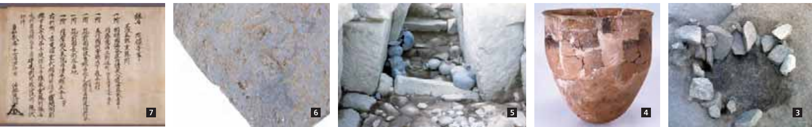
1 古代～中世の主な遺跡(昭和34年地形図を基に作成) 2 柏原合衆再製所凡図(林(美)文書) 3 縄文時代の集落跡から見つかった炉跡 4 1万年前頃の縄文土器 5 前方後円墳の石室入口付近では、当時のまま土器がのこされていた 6 9世紀頃の須恵器の皿。底部外面に「山守家」と書かれている 7 渋谷定円(重基)讓状(入来院家文書)。貞和2(1346)年、渋谷定円(重基)から養子の重勝へ譲られた所領のなかに、柏原村の名前が見える

と関わりのある者がいたようです。建物の敷地のそばに残る小字「山ノ口」から山に登った所に造られた前方後円墳の時期が、最初の建物と同じ六世紀後半頃であることが、それを示唆しています。