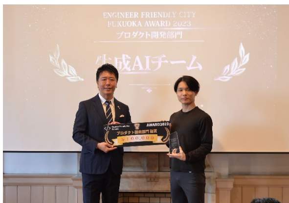
(エンジニアフレンドリーシティ福岡アワード)