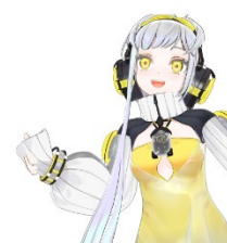
(デモ動画紹介を予定しております)