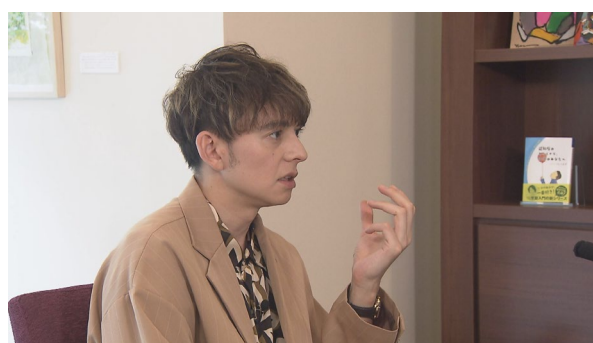
【実体験を語るハリー杉山氏】