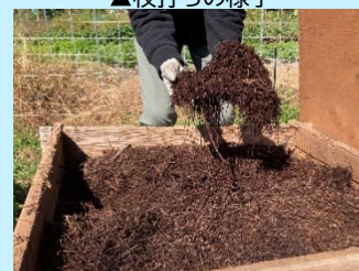
▲昨年事業で回収した松葉と魚の混合たい肥(当日お披露目します)