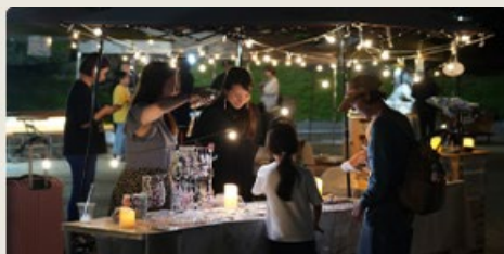
10月5日(日) マルシェイベント「お月見マルシェ」