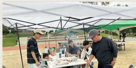
10月18日(土)、19日(日) BBQイベント