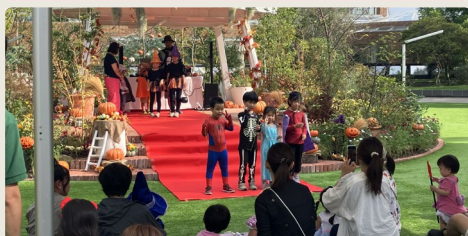
10月18日(土) ハロウィンイベント

温室前広場は、花やみどりをテーマにしたイベントはもちろん、季節やトレンドに合わせた多彩な企画にも対応できる柔軟なスペースです。開放感あふれるロケーションを活かし、マルシェやワークショップなど、ジャンルを問わず幅広い催しが可能です。