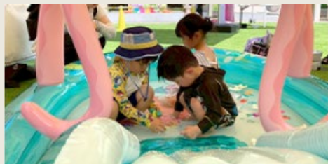
8月23日(土) 水遊びイベント「スプラッシュガーデン」