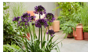
プレイバントで初披露した花 『アガパンサス・ブラックジャック』

Fukuoka Flower Show 2026に向けて、皆さんの試飲・投票で最終的な味を決定する参加型企画です。秋から春にかけてのイベントで試飲会を実施し、選ばれたブレンドは商品化を予定しています