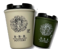
アウトドアカップ（一例）など 素敵なプレゼントをご用意しています