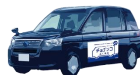
ユニバーサルデザインタクシー (乗客定員4人)