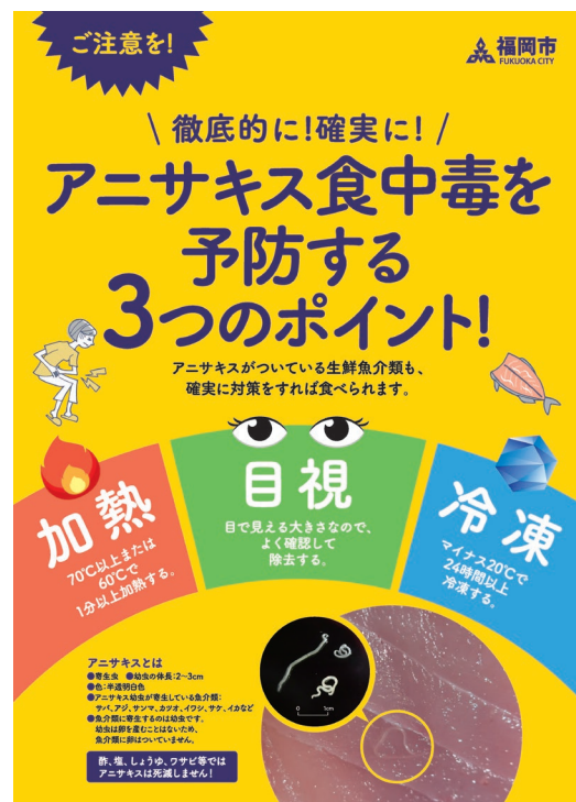
令和 6 年度「食中毒予防ポスター」