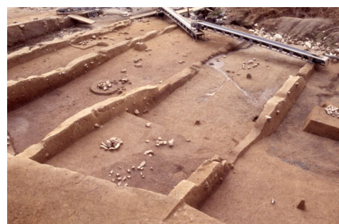
元岡・桑原遺跡群(西区)第3次調査 ※研究対象の遺跡の一つ