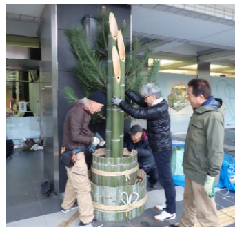
▲昨年度作業の様子