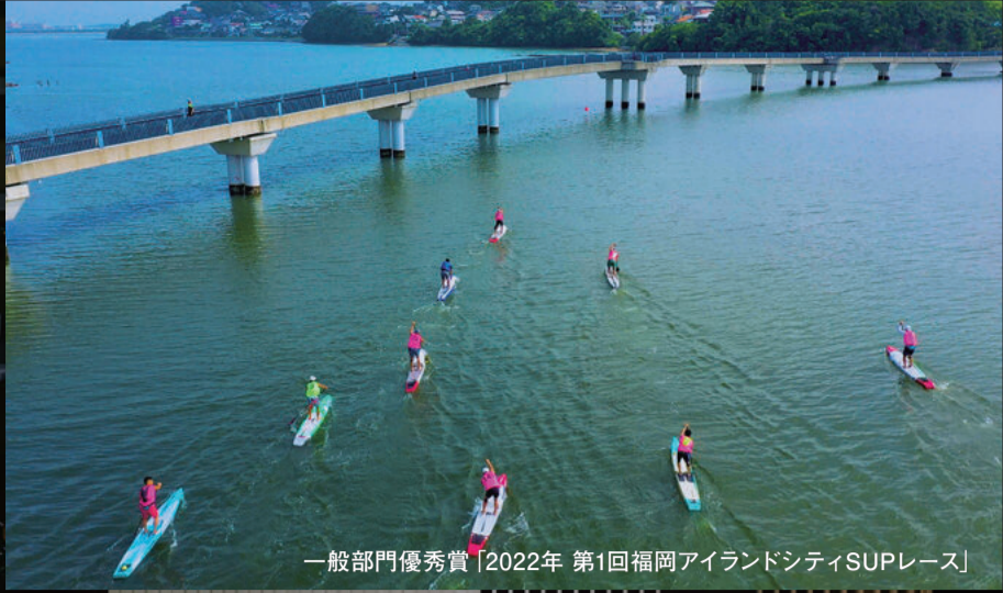
一般部門優秀賞「2022年 第1回福岡アイランドシティSUPレース」