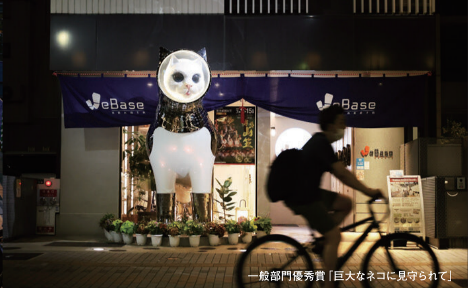
一般部門優秀賞「巨大なネコに見守られて」