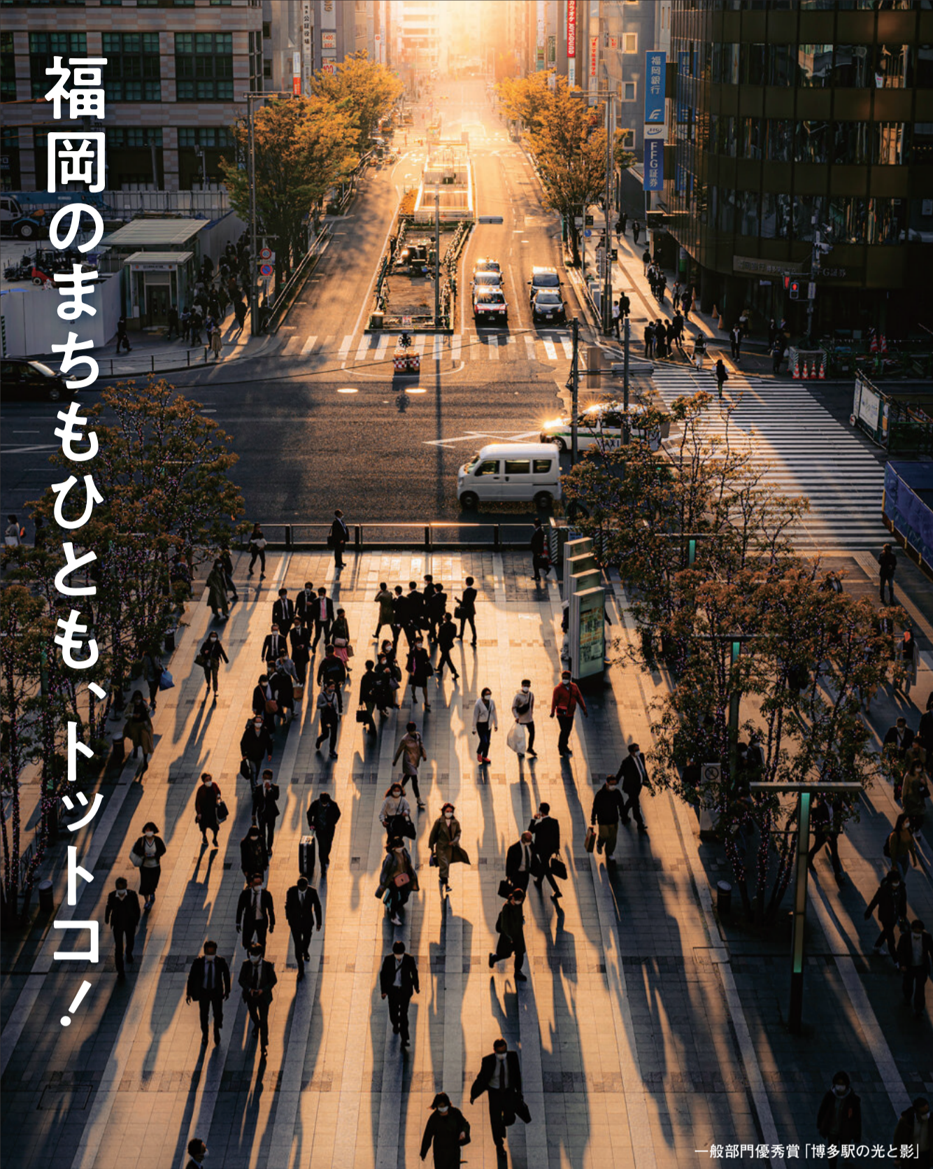
一般部門優秀賞「博多駅の光と影」