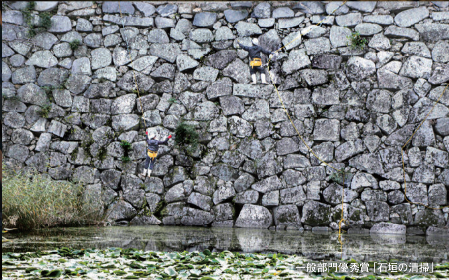
一般部門優秀賞「石垣の清掃」