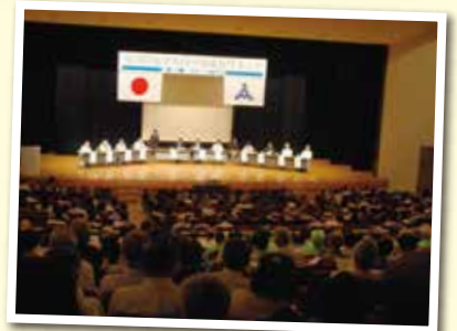
▲昨年の意見交換会の様子

お問い合わせ: 市民局コミュニティ推進課 TEL: 733-5161 FAX: 733-5595