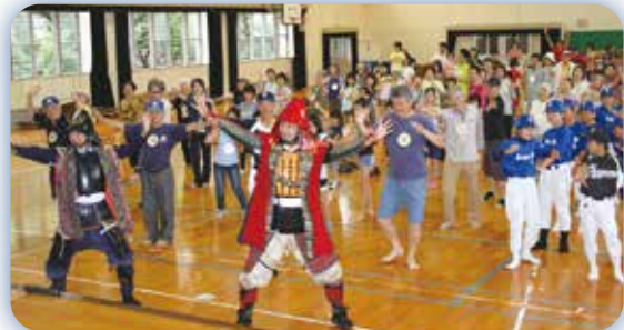
福岡黒田武将隊とのコラボ

毎回100名以上が参加し、その顔ぶれは子どもから高齢者までさまざまです。なかには、一人暮らしの高齢者もおられ、小学校に歩いてくるだけでも良い運動になり、自宅を出て、人とふれあうきっかけにもなっているようです。