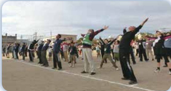
ひまわりサンデーラジオ体操

ラジオ体操は最近、その運動効果が改めて注目されており、幅広い世代と一緒に短時間で行えることも魅力です。