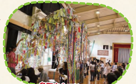
各町内会で競います

笹につるす飾り物は、空き箱を加工するなど、各町内会でお金をかけずに工夫して作っており、毎年、他の町内会に負けないようにと、各町内会が競いあっています。