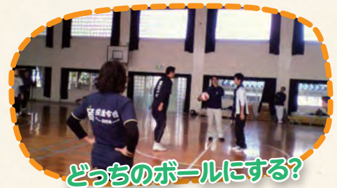
どっちのボールにする?

また、中学生が笑顔で活動している様子を観ているだけでも楽しいという声もあり、保護者以外の地域の方々にも足を運んでもらえるような大会を目指します。