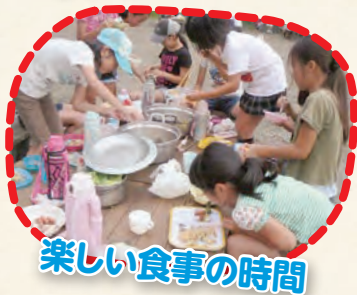
楽しい食事の時間

他にも、スポーツ大会のプラカード作成や子どもの日の行事の道具の準備等も行い、子ども会の活動を支えています。