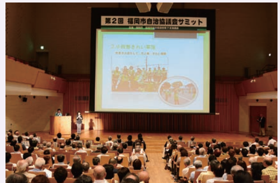
昨年の事例発表の様子