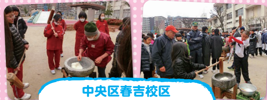
中央区春吉校区 三世代ふれあいまちつき大会