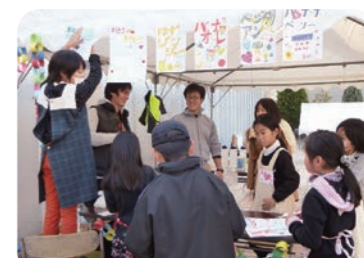
↑学園祭での「こども店長」

この交流をきっかけに、校区の運動会をはじめとして、いろいろな行事に学生を招待して交流を深めています。