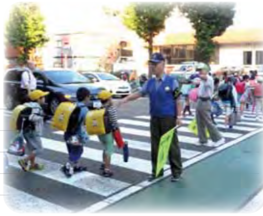
▲登校時活動の様子

挨拶ができる子できない子、その時の児童の様子などの状況に応じた対応をすること、また、公園などの不審者対策としても見守り隊の配置を工夫しているところです。