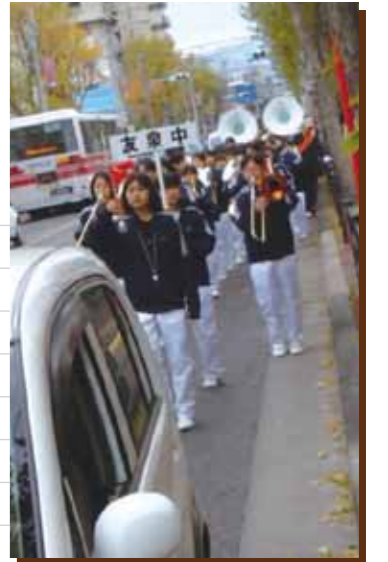
▲歳末、安全・安心パレード