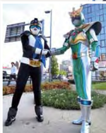
▲草ヶ江校区(中央区)のヒーロー「グラスサイダー」とコラボ。