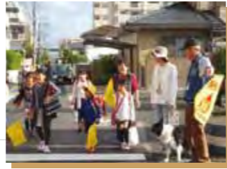
▲登校時活動の様子

子どもたちは、「みまもり隊」のカードを下げていることで、安心して挨拶をします。また、注意や安全指導をされても、よく聞き入れてくれます。