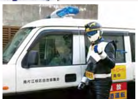
▲自治協議会青バト“ブルッパ”に同乗。小中学校下校時に合わせてパトロール!!