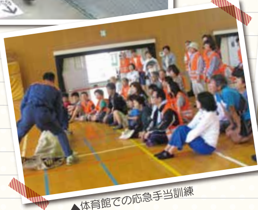
▲体育館での応急手当訓練