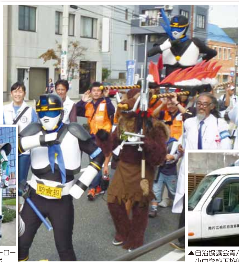
◀「ふれあい城南フェスティバル」でのパレード。

南片江校区では、校区住民の平和と安全を守るため、『ボウハンダーZ』が活躍しています。防犯に関する活動をはじめ、交通安全や防災の啓発活動などを通じて「地域住民が安心して暮らせるまち」や「子どもたちの笑顔があふれるまち」を目指して活動を行っています。