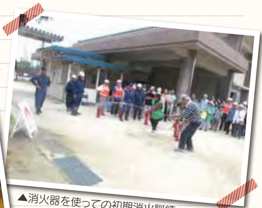
▲消火器を使つての初期消火訓練