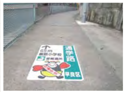
▲通学路と避難場所(小学校)への方向・距離が一目で分かります。