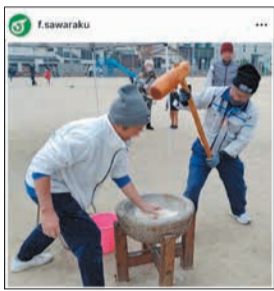
飯倉校区の餅つき大会

区公式インスタグラム(@f.sawaraku)では校区で行われるスポーツ大会や祭りなどのイベントの様子、地域の情報を写真や動画で紹介しています。