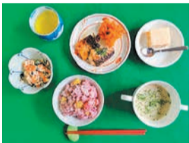
野菜たっぷり減塩料理

ヘルスマイト(食生活改善推進員)は、皆さんが健康な毎日を過ごせるよう、食生活や運動の大切さを伝える食育ボランティアです。区内では約100人のヘルスマイトが「私たちの健康は私たちの手で」をスローガンに、地域での食生活改善講習会や親子料理教室などを開催しています。