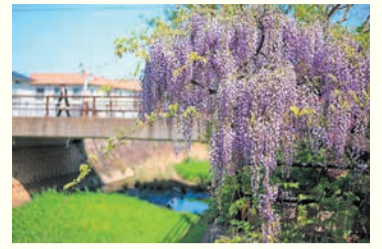
金屑川のフジ(賀茂駅周辺)

開 = 日時 所 = 場所 問 = 問い合わせ ☎ = 電話 ㊟ = ファクス 対 = 対象 定 = 定員 料 = 料金、費用 持 = 持参 託 = 託児 申 = 申し込み 電 = メール 開 = 開館時間 休 = 休館日