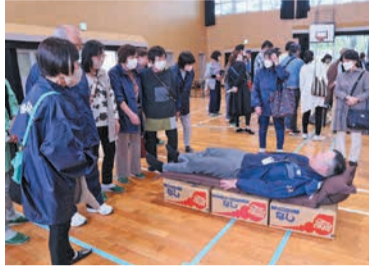
原西校区の防災訓練

子どもたちの登下校時の見守りや高齢者の見守りのほか、夜道でも安心して歩けるよう、防犯灯の設置などを行っています。また、災害時に安否確認や避難所運営がスムーズにできるよう、防災訓練なども実施しています。