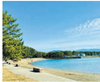
海と緑が豊かな小戸公園

区内の公園や、歴史が感じられる神社、史跡、区内で行われる祭りや行事などを紹介する「西区お出かけマップ」Ⅱ左写真Ⅱを区役所1階情報コーナーや、さいとびなどで配布しています。家族とのお出かけなどにご利用ください。