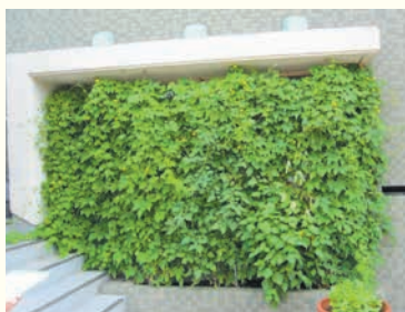
北崎公民館のゴーヤカーテン(昨年度)