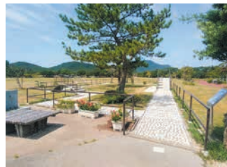
健康遊歩道(リフレッシュロード)

区内のレクリエーションの拠点施設として、体育館のほか、テニスコート、アスレチック広場などを擁しています。裸足で駆け回ったり、寝転んだりできる広大な芝生広場もあり、3月から5月頃まで、この芝生広場の一部にネモフィラが咲きます。