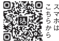
スマホはこちらから

「福ふくおかサポート」への登録方法やサービス内容などの詳細は、ホームページ(「福ふくおかサポート」で検索)でご確認ください。