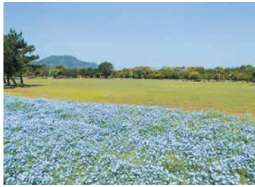
4月はネモフィラが満開になります

開=日時、開催日、期間 所=場所 関=対象 定=定員 料=料金、費用 申=申し込み 問=問い合わせ ☎=電話 ☎=ファクス ✉=メール 受=受付時間 持=持参