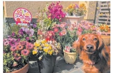
四季折々の花を植えています。育てることが、まちの力になっているように感じられてうれしいです。今後も自分のペースで、彩りのあるまちづくりに参加していきたいと思っています。

もともと趣味で花を植えていました。パートナー花壇に登録して、このプレートを立てると、自分が花を育てることが、まちの力になっているように感じられてうれしいです。今後も自分のペースで、彩りのあるまちづくりに参加していきたいと思っています。