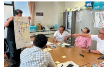
男女協や体育振興会、消防団など各種団体が意見を出し合いました

昨年1月以降6回にわたり行われ、た会議には、同校区自主防災組織をはじめ、公民館や消防団、地域住民が参加し、災害に対する備えの重要性や避難所の運営方法などについて話し合いました。