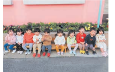
花壇は子どもたちにも好評です。子どもたちも水やりなどを手伝ってくれて、花が咲くのを楽しみにしています。花を見ながら会話が生まれ、コミュニケーションの場づくりにもつながっています。今後も地域の一員として、一人一花運動を推進していきたいです。

子どもたちや保護者の皆さん、地域の皆さんに喜んでもらいたいと思い、花を植えています。子どもたちも水やりなどを手伝ってくれて、花が咲くのを楽しみにしています。花を見ながら会話が生まれ、コミュニケーションの場づくりにもつながっています。今後も地域の一員として、一人一花運動を推進していきたいです。