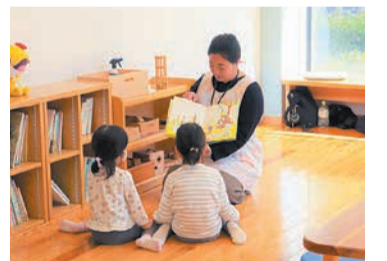
木の温かみを感じられるふれあい広場で保育士等が見守ります

区役所が混雑する時期に、子ども連れでも安心して手続きや相談ができるよう、保育士等が満1歳から就学前までの子どもを一時的に預かります。