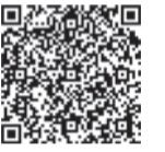
スマホはこちらから

パソコンやスマートフォンから、平日は区役所、土・日曜日は市内4カ所の証明サービスコーナーなどの来庁予約ができます。予約者を優先して受け付けるため、手続きが比較的短時間で完了します。来庁希望日の5営業日前の午前8時30分までに予約してください。詳細は、市ホームページ(「福岡市 引越しオンライン」で検索)で確認するか、市引越し手続き案内コールセンター(☎515-1787)へお問い合わせください。