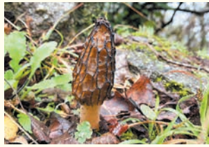
トガリアミガサタ (油山市民の森)