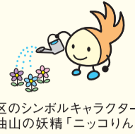
区のシンボルキャラクター 油山の妖精「ニコりん」

〒814-0192 城南区烏飼六丁目1-1 窓口受付時間:午前8時45分~午後5時15分 (土・日曜・祝休日・年末年始を除く) 区ホームページは「福岡市城南区」で検索